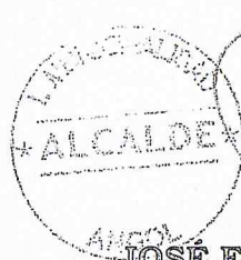
JOSÉ ENRIQUE NEIRA NEIRA ALCALDE DE ANGOL